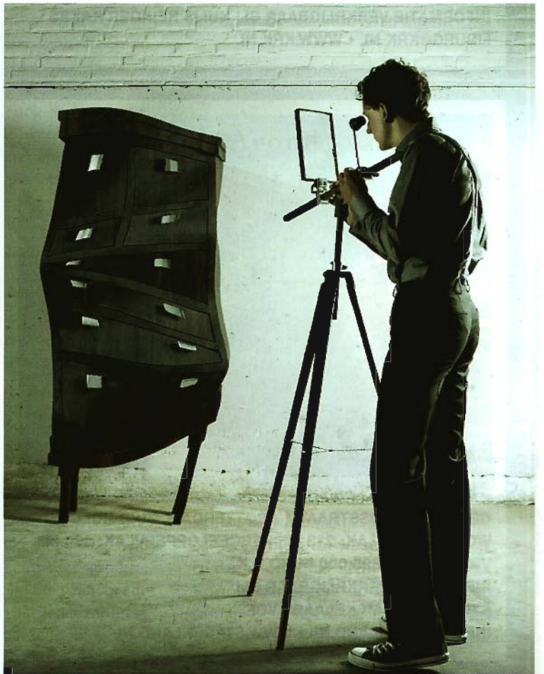
What it is, it isn't