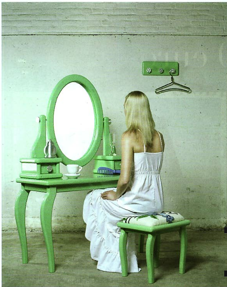
When I was little