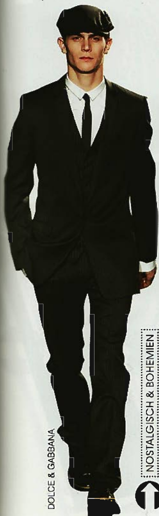
DOLCE & GABBANA